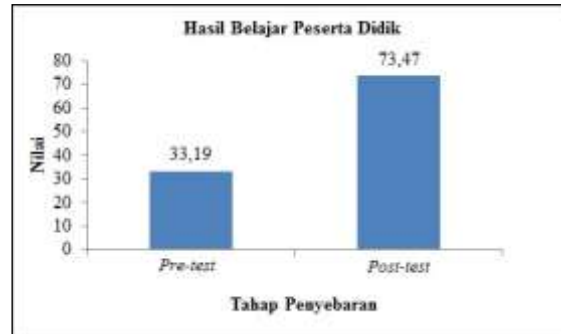
Gambar 5. Hasil Pre-test dan Post-test

Tahap penerapan hasil nilai pre-test menunjukkan nilai reratanya 33,19 dan nilai post-test menunjukkan nilai reratanya 73,47 memperoleh kriteria gain 0,602 dengan kategori sedang karena nilai gain termasuk dalam kriteria normalized gain 0,3 \leq g < 0,7 .