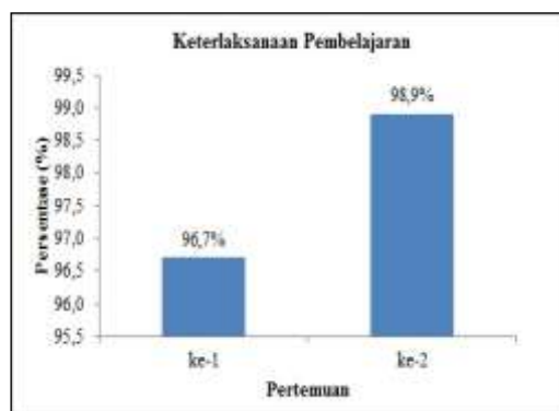
Gambar 4. Keterlaksanaan Pembelajaran

Data hasil respon peserta didik seperti ditunjukkan Gambar 3 , e -modul terdapat 4 aspek yaitu aspek kelayakan isi, aspek kebahasaan, aspek desain, dan aspek interaksi media. Aspek kelayakan mendapatkan persentase 85,6% dengan klasifikasi baik. Aspek kebahasaan mendapatkan persentase 83,6% dengan klasifikasi baik. Aspek desain mendapatkan persentase 84,9% dengan klasifikasi baik. Aspek interaksi media mendapatkan persentase 82,6% dengan klasifikasi baik.