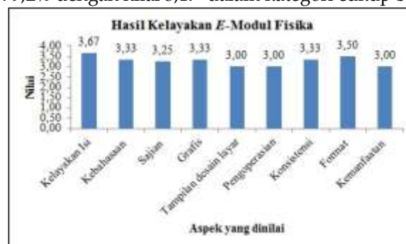
Gambar 2. Kelayakan e -Modul Fisika oleh Guru Fisika

Hasil validasi oleh dosen ahli pada aspek kelayakan isi diperoleh skor 10 sehingga memperoleh persentase 83,3% dengan nilai 3,33 dalam kategori cukup baik. Aspek kebahasaan diperoleh skor 9 sehingga memperoleh persentase 75% dengan nilai 3,00 dalam kategori cukup baik. Aspek sajian diperoleh skor 13 sehingga memperoleh persentase 81,3% dengan nilai 3,25 dalam kategori cukup baik. Aspek grafis diperoleh skor 9 sehingga memperoleh persentase 75% dengan nilai 3,00 dalam kategori cukup baik. Aspek tampilan desain layar diperoleh skor 15 sehingga memperoleh persentase 93,7% dengan nilai 3,75 dalam kategori baik. Aspek kemudahan pengoperasian diperoleh skor 7 sehingga memperoleh persentase 87,5% dengan nilai 3,50 dalam kategori cukup baik. Aspek konsistensi diperoleh skor 20 sehingga memperoleh persentase 83,3% dengan nilai 3,33 dalam kategori cukup baik. Aspek format diperoleh skor 14 sehingga memperoleh persentase 87,5% dengan nilai 3,50 dalam kategori cukup baik. Aspek kemanfaatan diperoleh skor 29 sehingga memperoleh persentase 79,2% dengan nilai 3,17 dalam kategori cukup baik.