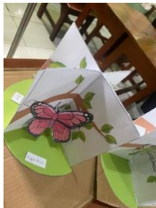
Gambar 1.3 proyek yang dibuat oleh siswa/i

Narasumber: Model PJBL yang saya pilih sangat efektif dalam mengukur dan meningkatkan antusiasme siswa dalam diskusi dan pembelajaran, karena siswa wajib didampingi dalam pembelajaran berlangsung, dimana siswa saya ajak untuk ikut berperan aktif dalam mengerjakan media pembelajaran yang sudah saya buat.