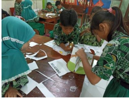
Gambar 1.2 proses pembuatan proyek

sedang dipelajari. Nantinya rasa ingin tahu anak akan tersampaikan melalui pertanyaan setelah media dijelaskan oleh saya