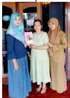
Gambar 1 Penyuluhan Kepada Ibu Hamil