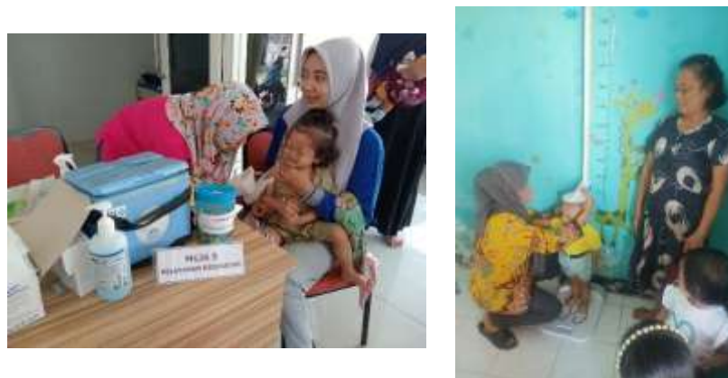
Gambar 3 Kegiatan Posyandu Di Desa Pangreh