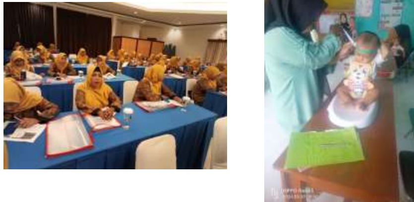
Gambar 2 Sumber Daya RDS Desa Pangreh