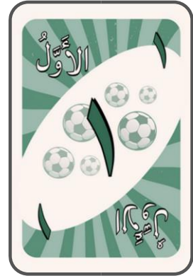
'Adad tartib mudzakkar