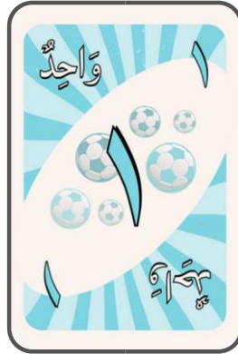
'Adad asli mudzakkar