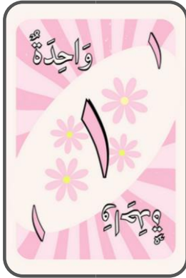
'Adad asli muannas