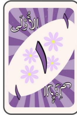
'Adad tartib muannas