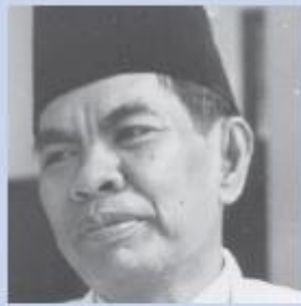
Gambar 1.2 Mr. Muhammad Yamin menjadi orang pertama penggagas mengenai dasar negara