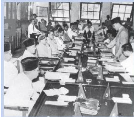
Gambar 1.4 Dalam sidang BPUPK, Ir. Soekarno menyampaikan rumusannya tentang pancasila yang kemudian dikaji serta dirumuskan ulang sehingga menjadi dasar negara Indonesia