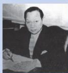
Gambar 1.3 Mr. Soepomo merupakan orang kedua yang mengusulkan tentang dasar negara