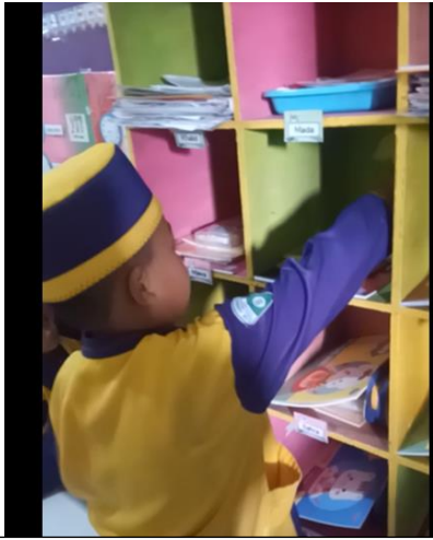
Meletakkan barangnya ke loker