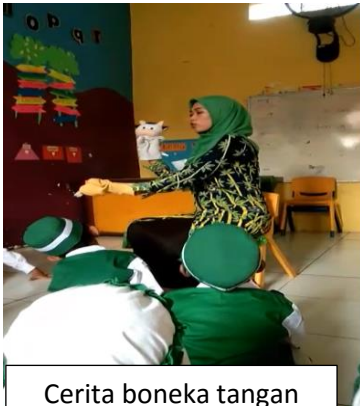
Cerita boneka tangan