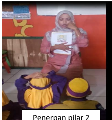
Penerapan pilar 2