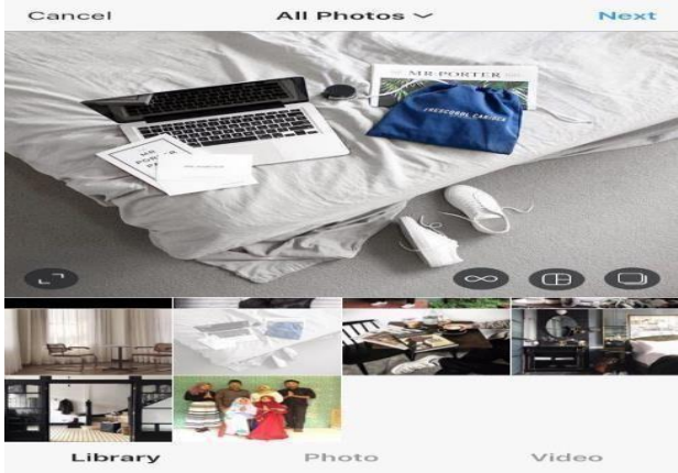
Gambar 1. Update Tampilan Camera atau Postinging Instgram