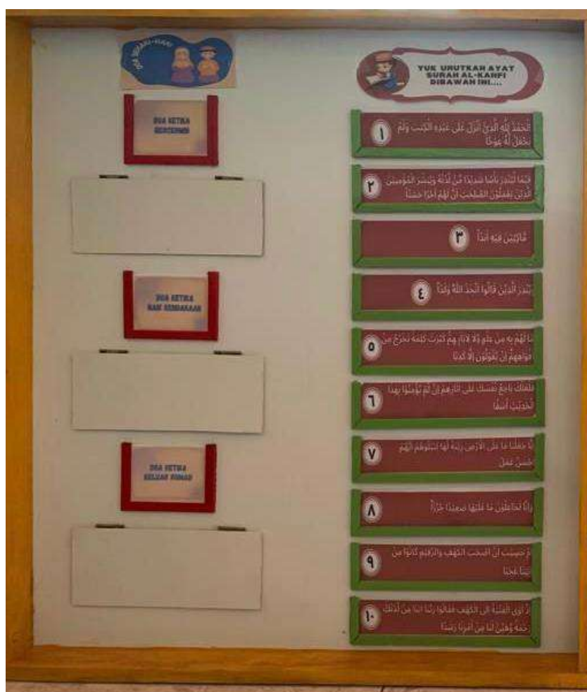
Gambar 1. Media Pembelajaran Papan Petunjuk Bermuatan Karakter Religius untuk Siswa dengan Gangguan ADHD