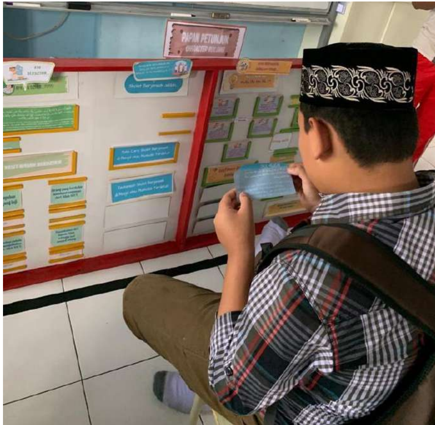
Gambar 2. Uji Coba Media Papan Petunjuk oleh 1 Siswa dengan Gangguan ADHD di lokasi penelitian