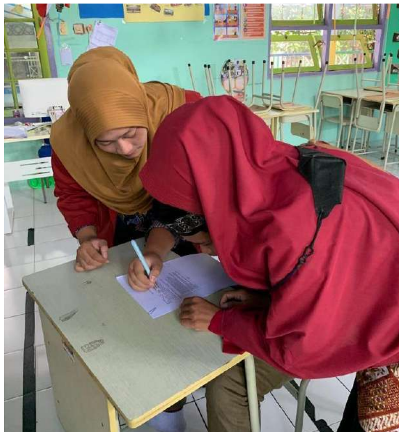
Gambar 3. Pengisian Angket Respon Siswa Terhadap Media Papan Petunjuk