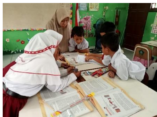
Gambar 1.6 Guru membimbing siswa