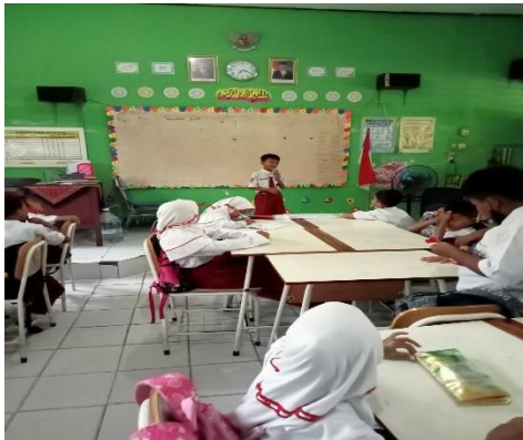
Gambar 1.11 Siswa bercerita