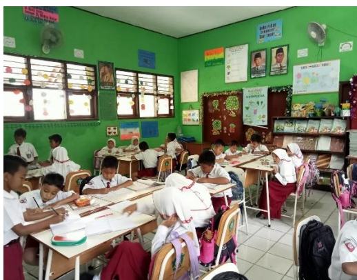
Gambar 1.13 Suasana kelas