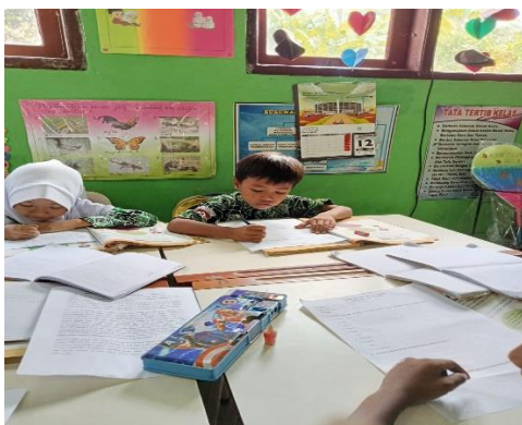
Gambar 1.5 Siswa mengerjakan soal mandiri