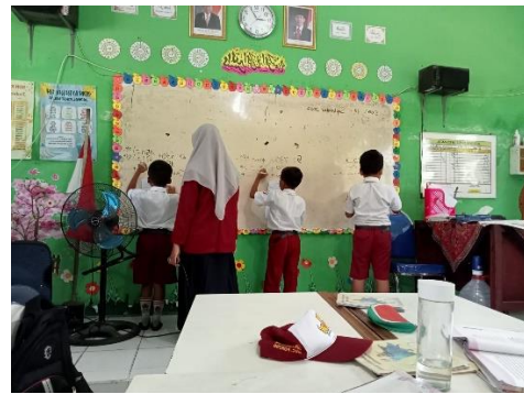
Gambar 1.10 Siswa mempresentasikan hasil kerja di papan tulis