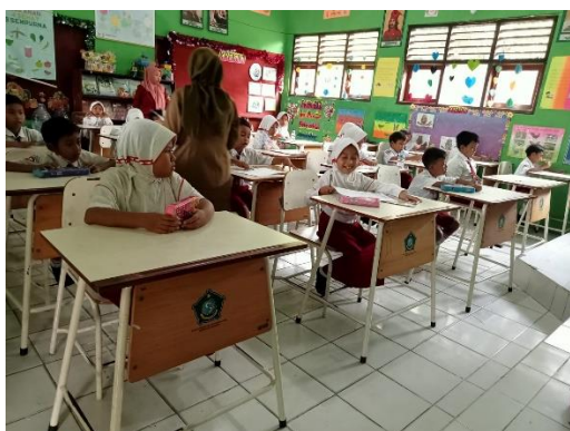
Gambar 1.15 Siswa mengerjakan ujian mandiri