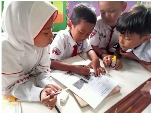
Gambar 1.7 Siswa berdiskusi