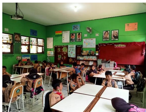
Gambar 1.16 Suasana kelas