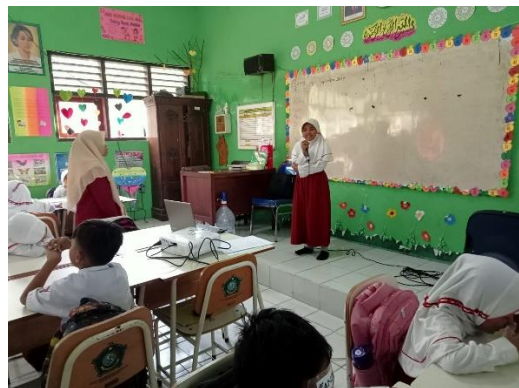
Gambar 1.12 Siswa mempresentasikan hasil kerja