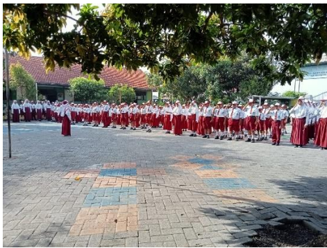
Gambar 1.9 Siswa mengikuti kegiatan upacara