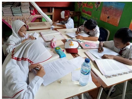
Gambar 1.14 Siswa terbiasa mengerjakan secara mandiri