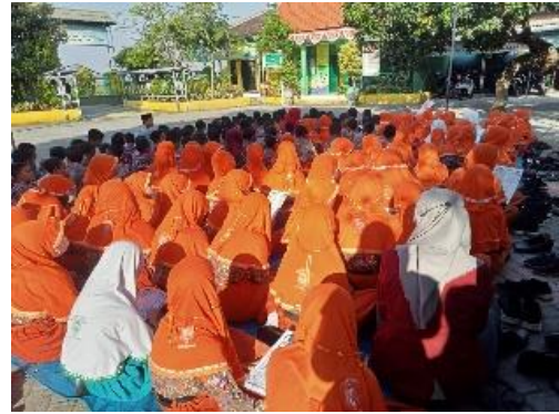
Gambar 1.8 Siswa mengikuti kegiatan istighosah