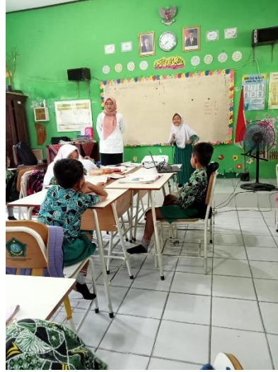
Gambar 1.2 Guru memberi teladan siswa