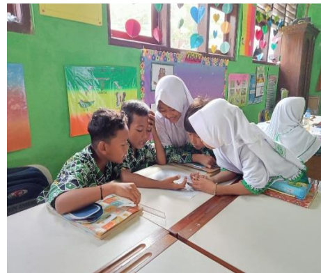
Gambar 1.4 Siswa diskusi untuk mengerjakan tugas kelompok