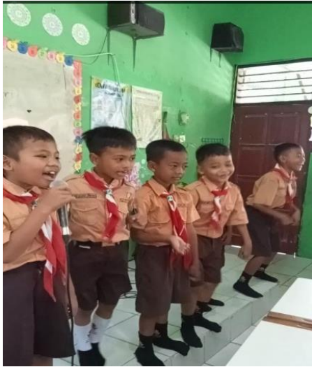
Gambar 1.1 Membuat yel-yel saat ekstrakurikuler pramuka