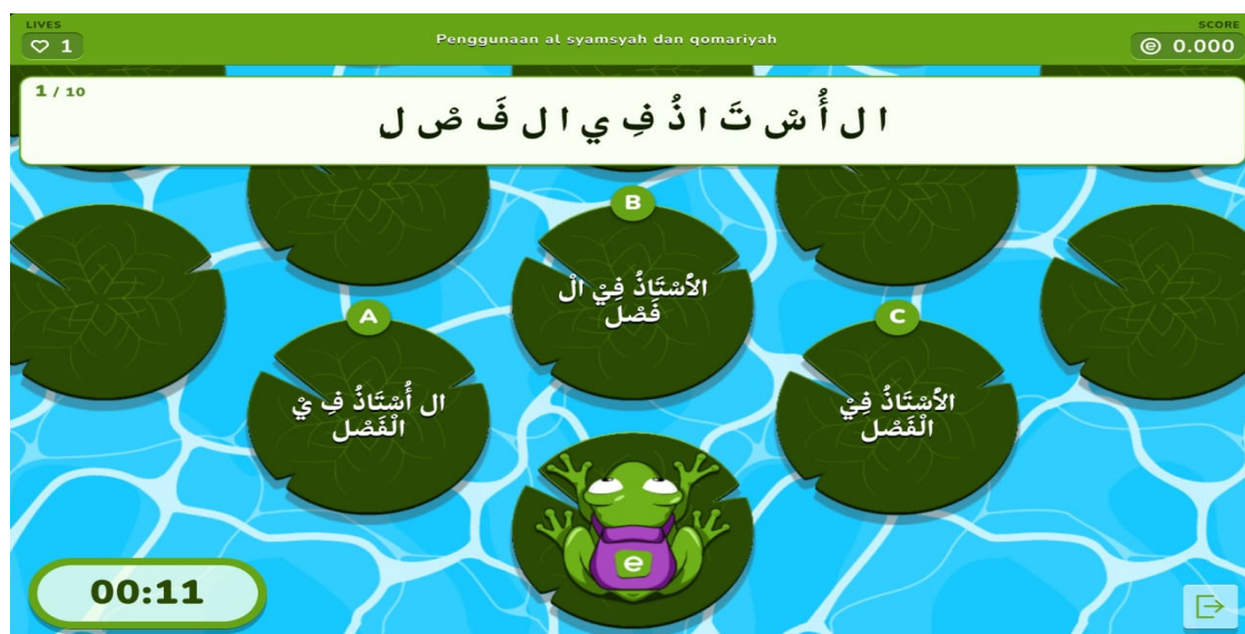
Gambar 1.2 Tampilan Media Interaktif froggy jump

Tahap pelaksanaannya penulis memanggil setiap kelompok untuk menyelesaikan kuis secara bersama. Dapat berdiskusi dengan kelompoknya dan menjawab sesuai dengan waktu yang disediakan. Setelah 3 kelompok telah mengerjakan kuis tersebut. maka tahap berikutnya yaitu evaluasi, penulis dapat membahas beberapa jawaban yang kurang benar dengan memberikan arahan yang sesuai dengan materi. Kekurangan dari media froggy jump yaitu ketika menggunakan froggy jump yaitu pada fitur jawaban hanya terdapat 3 kolom saja. Sedangkan pada jenjang SMP untuk pemilihan jawaban lebih dari 3. Kelebihan dari media froggy jump ini belajar lebih efektif melalui interaksi dan umpan balik secara cepat. Hal ini sesuai dengan Clark, R. E. menyatakan bahwa konsep games based learning peserta didik dapat tertantang dan keterlibatan dalam menyelesaikan kuis sesuai dengan target.