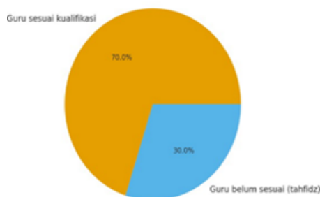
Gambar 1.kualifikasi guru

Perencanaan lain untuk guru dan tendik dilakukan melalui penyusunan rencana pelatihan internal, in-house training, dan pembinaan rutin pada awal dan pertengahan semester. Pelatihan ini berfungsi untuk meningkatkan kompetensi guru dan tendik [20].