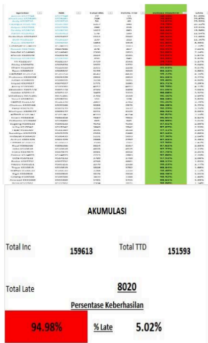
Gambar 2 : Keberhasilan dan kegagalan dalam target kiriman 95 persen

Berdasarkan hasil temuan diatas, penulis memberikan statement terhadap hasil temuan bahwa Gen Z yang bekerja sebagai kurir di J&T Cabang Buduran menghadapi Quarter Life Crisis (QLC) yang ditandai dengan kebingungan, tekanan emosional, dan pencarian makna dalam karier. Melalui analisis Johari Window, ditemukan bahwa sebagian besar karyawan nyaman berbagi cerita dengan rekan kerja terpercaya ( open area ), namun ada yang memilih menyembunyikan perasaan karena takut dianggap lemah ( hidden area ). Beberapa karyawan juga baru menyadari kelemahan mereka setelah mendapat umpan balik dari atasan atau rekan kerja ( blind area ), sementara tantangan kerja justru membantu mereka menemukan potensi tersembunyi ( unknown area ). SOP ketat perusahaan memperparah tekanan emosional, terutama dalam fase Locked-In dan Separation , yang membuat karyawan mulai mempertimbangkan opsi karier lain di fase Exploration . Namun, bagi yang berhasil beradaptasi, mereka mencapai fase Rebuilding dengan menemukan cara untuk bekerja lebih efektif dan membangun kembali keyakinan terhadap masa depan karier mereka.