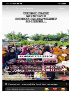
Gambar 3. Antrean Konsumen dan Informasi Jadwal Penjualan On The Road

Gambar ini menggambarkan aktivitas streaming langsung yang dilakukan oleh pembawa acara Dhila Food melalui akun TikTok resminya. Dalam sesi ini, pembawa acara memperkenalkan berbagai produk olahan seperti Sambal Bakar dan Saos Ayam Riris kepada penonton, sekaligus menjelaskan komposisi, keunggulan, dan manfaatnya. Taktik ini bertujuan untuk meningkatkan pemahaman konsumen tentang kualitas dan nilai produk selain meningkatkan minat mereka untuk melakukan pembelian.