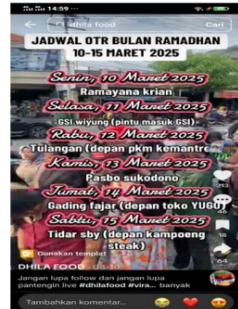
12 Gambar 4. Jadwal Penjualan On The Road (OTR) Dhila Food Bulan Ramadhan

Selain menunjukkan antusiasme pembeli, video ini juga memberikan informasi mengenai jadwal penjualan berikutnya, termasuk waktu dan lokasi di mana tim Dhila Food akan berjualan keesokan harinya. Informasi ini merupakan bagian dari strategi komunikasi yang secara konsisten dijalankan Dhila Food untuk menjaga keterikatan dengan konsumennya.