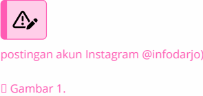
Postingan akun @infodarjo 8 Februari 2025 (Sumber :