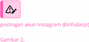
Postingan akun @infodarjo 8 Februari 2025