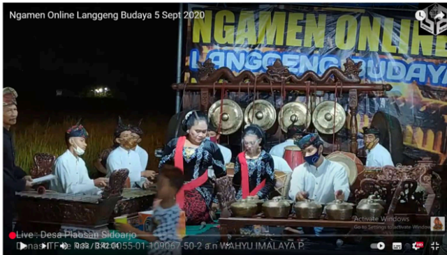
Gambar 3.1 Moment “Ngamen Online”.