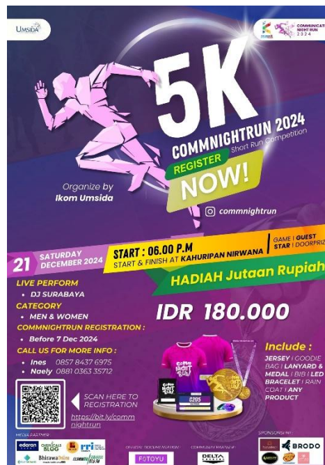
Gambar 5. Poster Commnightrun

Sebelum pelaksanaan event, pembahasan lebih sering dilakukan untuk mempersiapkan kebutuhan internal maupun eksternal pada event, di bulan desember pematangan konsep acara dan persiapan kebutuhan alat serta properti yang dibutuhkan ketika event berlangsung.