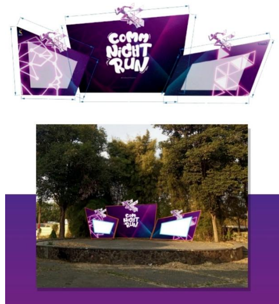
Gambar 4. Desain Panggung

Branding menjadi hal yang sangat penting terhadap keberhasilan sebuah event terutama pada event Commnightrun, branding tidak hanya sebagai identitas visual atau nama acara, tetapi juga sebagai simbol semangat, sehat dan akrab. Branding yang paling menonjol adalah nama event Commnightrun gabungan dari kata “communication” dan “night run” secara tidak langsung membawa identitas Program Studi Ilmu Komunikasi tanpa perlu menjelaskan bahwa event tersebut diadakan oleh para mahasiswa. Lebih dari sekedar nama, branding commnightrun berhasil menjadi jembatan yang menghubungkan lapisan masyarakat, melalui pendekatan terbuka, event ini mampu merangkul para alumni, calon mahasiswa baru, hingga masyarakat umum dalam satu wadah. Keberhasilan branding commnightrun tercermin dari banyaknya jumlah peserta yang antusias, exposure yang didapat, serta citra prodi ilmu komunikasi.