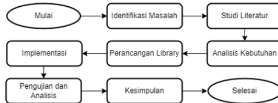
Gambar 1. Alur Metode Penelitian

Pada bab metode ini memberikan pemaparan tentang alur kerja penelitian dengan penjelasan singkat di dalamnya. Alur metode penelitian diawali dengan identifikasi masalah yang terjadi kemudian dilanjutkan dengan studi literatur, Analisis Kebutuhan, Perancangan Library, Implementasi, Pengujian dan analisis, dan kesimpulan. Alur metode penelitian digambarkan pada gambar 1 dan disertai penjelasan singkat pada tiap segmen alur.