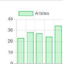
Article Per Year (5 Year)