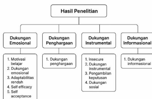
Gambar 2. Diagram Alur Hasil Penelitian

Temuan dari kedua informan mengungkap bahwa dukungan informasional orangtua berupa pemberian pemahaman dan strategi pembelajaran yang sesuai dengan kebutuhan anak disleksia berperan penting dalam menciptakan proses pembelajaran yang adaptif serta mendorong motivasi belajar secara berkelanjutan.