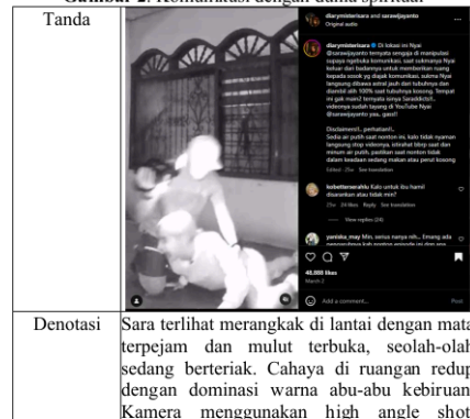
Gambar 2. Komunikasi dengan dunia spiritual

Analisis terhadap gambar 1, yang menunjukkan Sara berdiri di depan sesajen, interpretasi denotatif dan konotatifnya memperlihatkan bagaimana elemen visual mendukung narasi spiritual. Berdasarkan teori Barthes, penggunaan warna merah dan pencahayaan redup dalam adegan ini tidak hanya memberikan efek dramatis tetapi juga memiliki makna konotatif yang terkait dengan dunia gaib. Posisinya yang berdiri di depan sesajen dengan ekspresi datar memperkuat kesan bahwa ia sedang melakukan kontak dengan entitas spiritual. Keberadaan sesajen dalam budaya mistis tradisional memiliki makna mitologis sebagai alat komunikasi dengan dunia tak kasat mata, sehingga dalam konteks ini, visual yang ditampilkan dalam akun Instagram Sara mencerminkan praktik spiritual yang sudah dikenal dalam budaya lokal, meskipun divisualisasikan ulang dalam format digital