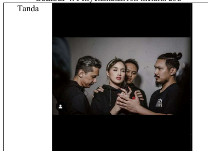
Gambar 4. Penyelamatan roh melalui doa