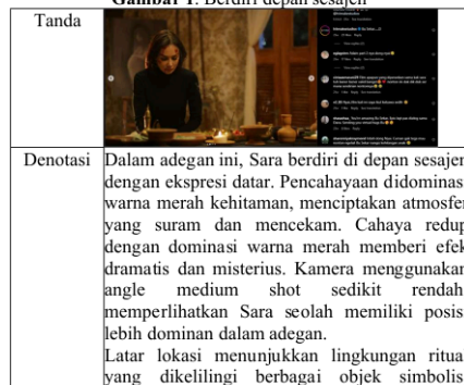
Gambar 1. Berdiri depan sesajen

Analisis lebih lanjut terhadap gambar dibawah ini