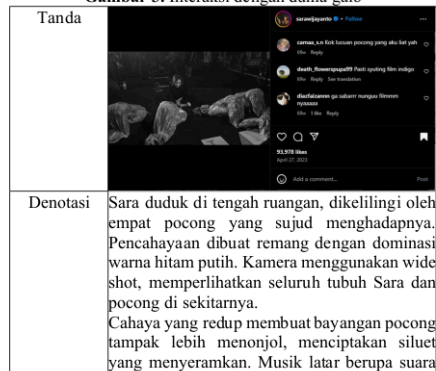
Gambar 3. Interaksi dengan dunia gaib

Pada gambar 2, tidak hanya menggambarkan komunikasi dengan dunia spiritual dalam konteks tradisional, tetapi juga menunjukkan bagaimana media sosial merepresentasikan pengalaman mistis dengan pendekatan visual yang memanfaatkan simbolisme budaya dan elemen sinematik. Hal ini memperkuat narasi tentang peran medium dalam praktik spiritual kontemporer, di mana pengalaman trance tidak hanya menjadi bagian dari ritual, tetapi juga sebuah performa visual yang membangun keterlibatan audiens di dunia digital.