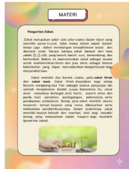
Gambar 3. Materi Zakat

Gambar di atas menampilkan hasil akhir desain sampul e-book yang telah dibuat. Ilustrasi pada sampul menggambarkan aktivitas zakat sebagai tema utama. Proses penyusunan e-book dimulai dengan memilih template dokumen A4 di Canva, yang sudah mencakup halaman sampul dan isi yang dapat disesuaikan sesuai kebutuhan. Canva sendiri menyediakan beragam template, font, serta ilustrasi yang diperlukan. Setelah template dipilih, sampul didesain ulang menggunakan ilustrasi yang relevan dengan tema e-book, kemudian ditambahkan judul. Jumlah halaman pun disesuaikan setelah memasukkan materi yang telah disiapkan sebelumnya, dengan menyisipkan ilustrasi pendukung di antara paragraf materi agar lebih menarik.