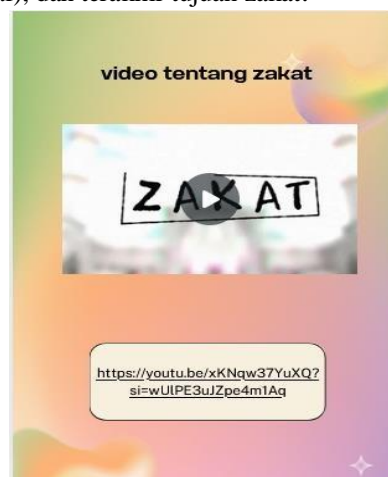
Gambar 4. Vidio animasi tentang zakat

Tahapan berikutnya adalah mengembangkan rancangan yang sudah dibuat, dimulai dengan mengimpor desain dari Canva, kemudian dilanjutkan dengan menambahkan pembelajaran mengenai materi zakat. Didalamnya terdapat materi tentang zakat antara lain sebagai berikut definisi zakat, dasar hukum zakat, jenis-jenis zakat, syarat wajib zakat, golongan penerima zakat (asnaf), dan terakhir tujuan zakat.