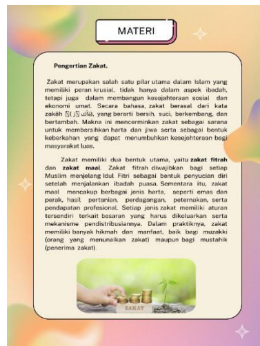
Gambar 3. Materi Zakat

Gambar di atas menampilkan hasil akhir desain sampul e-book yang telah dibuat. Ilustrasi pada sampul menggambarkan aktivitas zakat sebagai tema utama. Proses penyusunan e-book dimulai dengan memilih template dokumen A4 di Canva, yang sudah mencakup halaman sampul dan isi yang dapat disesuaikan sesuai kebutuhan. Canva sendiri menyediakan beragam template, font, serta ilustrasi yang diperlukan. Setelah template dipilih, sampul didesain ulang menggunakan ilustrasi yang relevan dengan tema e-book, kemudian ditambahkan judul. Jumlah halaman pun disesuaikan setelah memasukkan materi yang telah disiapkan sebelumnya, dengan menyisipkan ilustrasi pendukung di antara paragraf materi agar lebih menarik.