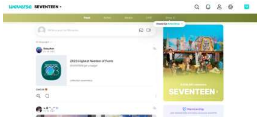
Gambar 1. Membership SEVENTEEN Aplikasi Weverse [7]

Ada beberapa fitur bantuan serupa notifications diperlukan sebagai informasi segala kegiatan idol K-pop di Weverse. Berbeda dengan Twitter maupun Instagram, Weverse sendiri hanya menyediakan isi berupa konten-konten pada media serta untuk sarana komunikasi antara para fandom dengan idolanya secara langsung, tujuannya menyajikan informasi aktual dalam kegiatan idol dan sebagai hiburan, berhubungan antara penggemar saling membantu satu sama lain, saling memberikan motivasi, serta mencapai tujuan bersama, karena mereka memperlakukan sesama penggemar sebagai anggota keluarga [6].