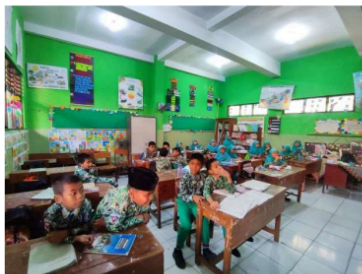
Gambar 2. Dokumentasi peneliti terhadap bapak guru kelas 4A yang sedang melaksanakan dan menjelaskan media pembelajaran ular tangga.

membuat pembelajaran dikelas tidak membosankan dan murid menjadi sangat interaktif Ketika pembelajaran sedan dilangsungkan, maka dari itu perlu adanya ke kreatifitasan dari guru di dalam pembelajaran di kelas supaya pembelajaran di kelas supaya pembelajaran dikelas mempunyai banyak macam varian saat pembelajaran di kelas.