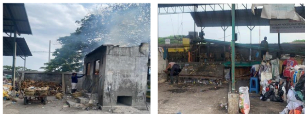
Sumber : TPS 3R SedatiGede

Dari fenomena yang dijelaskan di atas, jika dikaitkan dengan teori implementasi menurut Edward III, sumber daya dapat dianggap sebagai salah satu faktor kunci yang mempengaruhi keberhasilan atau kegagalan suatu program. Keterbatasan sumber daya dalam pelaksanaan program TPS 3R di SedatiGede menunjukkan bahwa teori Edward III sangat relevan dalam menjelaskan tantangan yang dihadapi saat implementasi kebijakan di lapangan. Ketika sumber daya yang tersedia tidak mencukupi, pelaksanaan program akan terhambat, sehingga tujuan program menjadi sulit untuk dicapai. Situasi ini menegaskan pentingnya perencanaan yang matang serta pengelolaan sumber daya yang efektif dan efisien dalam pelaksanaan kebijakan publik. Dengan demikian, diperlukan perhatian lebih pada aspek sumber daya untuk memastikan keberhasilan program-program yang dirancang demi kesejahteraan masyarakat.