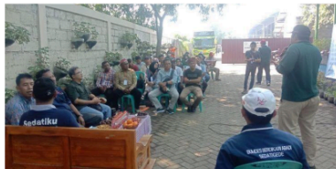
Gambar 1. Sosialisasi Pengelolaan TPS 3R SedatiGede