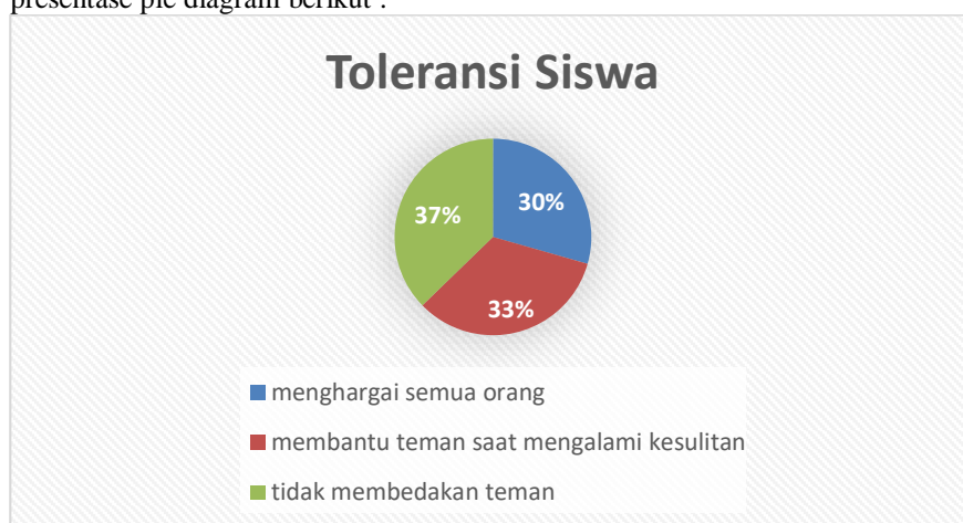
Diagram 1. Sikap Toleransi siswa

Secara general, pola yang di hasilkan dari internalisasi rahmatan lil alamin pada sekolah dasar tersebut terbagi pada beberapa presentasi Berikut hasil toleransi yang terjadi di sekolah dasar yang diperoleh dapat dijelaskan melalui presentase pie diagram berikut :