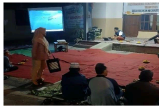
Gambar 4. Pengkoordinasian BUMDesa Mitra Warga Kesiman

Pernyataan tersebut menunjukkan bahwa masyarakat Desa Kesiman memainkan peran aktif dalam proses pengkoordinasian yang dilakukan oleh BUMDesa Mitra Warga Kesiman. Partisipasi mereka tidak hanya terbatas pada menyampaikan aspirasi atau sekadar mengikuti forum-forum diskusi, tetapi juga terlibat langsung dalam berbagai tahapan implementasi program yang dirancang bersama. Keberhasilan dalam aspek koordinasi tersebut juga tercermin dari partisipasi aktif masyarakat dalam pengembangan infrastruktur pendukung, seperti peningkatan kualitas jalan menuju lokasi wisata dan penyediaan fasilitas umum yang lebih representatif bagi pengunjung. Koordinasi yang dilakukan oleh BUMDesa tidak hanya melibatkan pertemuan atau musyawarah, tetapi juga membangun sistem komunikasi dua arah antara pengelola dan masyarakat. Setiap keputusan yang diambil melibatkan pendapat warga, sehingga kebijakan yang diterapkan tidak hanya mencerminkan visi pengelola, tetapi juga kebutuhan dan harapan masyarakat setempat.