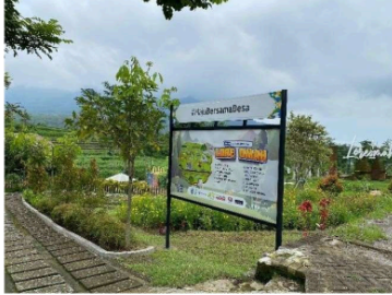
Gambar 1. Wisata Kuliner Lore Omah