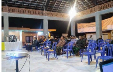
Gambar 3. Pengarahan BUMDesa Mitra Warga Kesiman