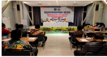
Gambar 1: Kegiatan Musyawarah Desa (MUDES) Tentang Perencanaan Pembangunan Desa Oleh Pemerintah Desa Durensewu Pada Tahun 2024.