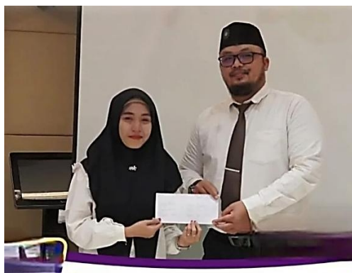
Gambar 7. Penyerahan Intensif Kepada Guru Oleh Kepala Sekolah

Gambar 7 di atas memperlihatkan simbolisasi pentingnya faktor finansial dalam menjaga motivasi kerja. Proses penyerahan insentif tidak hanya berfungsi administratif, tetapi juga menumbuhkan rasa kebersamaan dan penghargaan kolektif. Hal ini menunjukkan bahwa gaji dan tunjangan berperan sebagai bentuk apresiasi formal yang memperkuat ikatan emosional antara pihak sekolah dan guru. Secara kualitatif, momen ini menciptakan suasana kondusif yang mendorong guru untuk tetap loyal dan berkomitmen terhadap tugasnya. Temuan observasi juga mendukung bahwa suasana penerimaan insentif menciptakan lingkungan kerja yang positif. Guru merasa lebih diperhatikan, sehingga tumbuh perasaan memiliki ( sense of belonging ) terhadap sekolah. Hal ini menegaskan bahwa pemberian insentif tidak hanya memenuhi kebutuhan finansial, tetapi juga berfungsi sebagai sarana membangun motivasi kolektif yang memperkuat iklim kerja. Dengan demikian, indikator gaji dan tunjangan memiliki dimensi ganda: ekonomis dan psikologis.