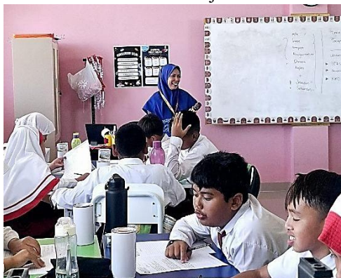
Gambar 2. Proses Pembelajaran di Kelas IV

Gambar 2 di atas menunjukkan suasana kelas yang penuh semangat, di mana guru terlihat antusias dalam menyampaikan materi dan memberikan arahan, sementara siswa menunjukkan keterlibatan aktif. Ekspresi semangat guru saat memberikan penguatan dan apresiasi kepada siswa merupakan bentuk nyata dari motivasi intrinsik yang hadir dalam proses belajar mengajar. Interaksi positif ini memperlihatkan bahwa dorongan dari dalam diri guru, seperti rasa puas ketika siswa memahami pelajaran, menjadi penggerak utama dalam aktivitas mengajar. Dengan demikian, motivasi intrinsik tidak hanya tercermin dalam sikap internal, tetapi juga dapat diamati melalui tindakan nyata yang memengaruhi keberhasilan proses pembelajaran.