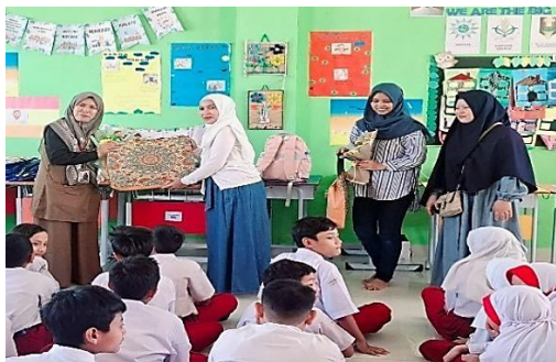
Gambar 9. Apresiasi Untuk Guru Kelas Dari Murid beserta Wali Murid Kelas IV

Gambar 9 diatas menunjukkan bahwa tampak siswa dan wali murid memberikan apresiasi kepada guru kelas. Apresiasi ini bukan hanya simbolis, tetapi juga menunjukkan adanya keterikatan emosional yang kuat antara guru, siswa, dan orang tua murid. Pengakuan tersebut membuat guru merasa pekerjaannya benar-benar dihargai dan bermanfaat bagi perkembangan anak didik. Dari sudut pandang motivasi, apresiasi yang datang dari murid dan wali murid tidak hanya menjadi pendorong ekstrinsik, tetapi juga memperkuat motivasi intrinsik guru dalam mengajar dengan penuh dedikasi.