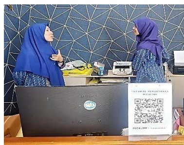
Gambar 11. Koordinasi Guru Dengan Bagian Adminitrasi Sekolah

Menurut Herzberg (1959), dukungan administratif termasuk dalam faktor hygiene yang sangat memengaruhi rasa puas atau tidak puas seorang pegawai. Jika sistem administrasi tidak berjalan baik, maka guru cenderung merasa terbebani dan motivasi menurun. Namun, jika dukungan administratif diberikan secara optimal, guru dapat lebih fokus pada tugas utamanya yaitu mengajar [21]. Dalam konteks sekolah, dukungan administratif mencakup kemudahan pengurusan dokumen, ketersediaan fasilitas kerja, serta adanya sistem yang membantu guru dalam menjalankan kewajiban non-pedagogis. Untuk memahami lebih jauh mengenai bentuk dukungan administratif yang diterima guru, peneliti juga melakukan observasi langsung di sekolah. Observasi ini bertujuan untuk melihat bagaimana interaksi antara guru dengan bagian administrasi sekolah dalam menyelesaikan tugas-tugas non-pengajaran. Hasil dokumentasi menunjukkan adanya aktivitas koordinasi antara guru dan staf administrasi yang menjadi bagian penting dalam menunjang kelancaran proses belajar mengajar.