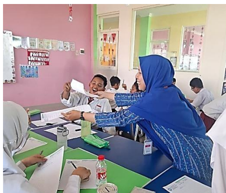
Gambar 4. Proses Belajar Mengajar yang Menyenangkan Saat di dalam Kelas

Gambar 4 diatas suasana kelas yang dinamis, di mana guru tampil penuh antusias dalam menyampaikan materi, menggunakan variasi metode, serta membangun dialog dengan siswa. Kelas yang semula ramai dapat dikendalikan dengan energi positif, sehingga tercipta kondisi belajar yang kondusif. Hal ini memperlihatkan bahwa semangat mengajar bukan hanya aspek emosional, melainkan juga strategi yang berperan langsung dalam menjaga kualitas pembelajaran. Dokumentasi ini menegaskan bahwa motivasi intrinsik guru dapat berdampak nyata terhadap atmosfer kelas. Hasil wawancara dengan guru menunjukkan bahwa semangat mengajar tetap terjaga meskipun ada masalah di luar sekolah. Guru menuturkan: "Kalau saya sudah berada di depan kelas, saya merasa bersemangat, meskipun ada masalah di luar sekolah. Rasanya energi saya keluar ketika mengajar anak-anak." Kutipan ini memperlihatkan bahwa semangat mengajar berfungsi sebagai mekanisme psikologis yang membantu guru mengesampingkan beban pribadi demi menjalankan tugas profesinya. Hal ini memperkuat pandangan bahwa motivasi intrinsik dapat melampaui faktor-faktor eksternal, karena dorongan tersebut tumbuh dari dalam diri dan berhubungan dengan nilai serta makna yang dilekatkan pada profesi guru.