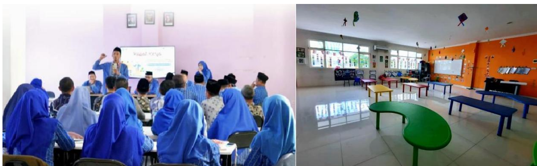
Gambar 10. Rapat Kerja Seluruh Guru SD

Gambar 10 diatas memperlihatkan suasana rapat kerja yang melibatkan seluruh guru di sekolah. Dalam forum ini terlihat bahwa guru tidak hanya berinteraksi secara formal, tetapi juga membangun ikatan sosial yang positif melalui diskusi, saling bertukar pendapat, serta menyepakati strategi pembelajaran bersama. Kehadiran ruang rapat yang nyaman dan tertata rapi juga memberi kesan profesional sekaligus memunculkan rasa dihargai. Hal ini selaras dengan teori Herzberg bahwa lingkungan kerja yang mendukung dapat menurunkan potensi ketidakpuasan sekaligus meningkatkan keterlibatan dalam pekerjaan. Hasil observasi mendukung data wawancara tersebut. Lingkungan sekolah terlihat terawat dengan baik, mulai dari ruang kelas yang bersih, papan tulis yang dalam kondisi layak, hingga fasilitas teknologi sederhana seperti proyektor dan pengeras suara yang digunakan dalam proses pembelajaran. Selain itu, guru juga tampak berinteraksi secara harmonis dalam aktivitas sehari-hari. Misalnya, saat waktu istirahat, guru-guru saling berbagi pengalaman mengenai strategi mengajar dan solusi atas permasalahan siswa. Situasi ini menunjukkan bahwa lingkungan kerja yang sehat tidak hanya dibentuk dari aspek fisik, tetapi juga melalui aspek sosial berupa kolaborasi antar rekan kerja.