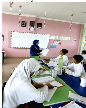
Gambar 3. Proses Pembelajaran di Kelas IV Umar Bin Khattab

Gambar 3 di atas menunjukkan interaksi guru dan siswa dalam suasana kelas yang penuh semangat. Guru terlihat aktif memberikan arahan, sementara siswa tampak antusias mengikuti kegiatan belajar. Ekspresi positif guru ketika siswa berhasil menjawab pertanyaan maupun menyelesaikan tugas menandakan adanya kepuasan pribadi yang terwujud dalam bentuk nyata di kelas. Melalui penguatan verbal seperti “Bagus sekali!” atau “Hebat, kamu sudah bisa,” guru tidak hanya menumbuhkan motivasi siswa, tetapi juga merasakan kebahagiaan tersendiri sebagai bagian dari keberhasilan proses pembelajaran.