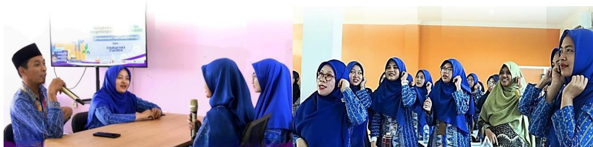
Gambar 8. Rapat Kerja Guru SD Muhammadiyah 1 Candi

Gambar 8 diatas menunjukkan kegiatan rapat kerja guru di SD Muhammadiyah Candi. Kolaborasi antar guru dalam rapat kerja ini menjadi wujud nyata adanya pengakuan sejawat. Guru merasa dihargai ketika diberikan kesempatan untuk menyampaikan ide dalam forum resmi sekolah. Situasi tersebut diamati secara langsung, di mana interaksi yang terjadi mencerminkan suasana kerja yang saling mendukung. Dukungan dari rekan sejawat melalui rapat kerja tidak hanya mendorong peningkatan profesionalisme, tetapi juga memberikan energi motivasional yang membantu guru menjalankan peran pendidikannya dengan lebih optimal. Sedangkan untuk pengakuan siswa ditunjukkan pada gambar berikut: