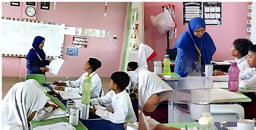
Gambar 5. Guru Memberikan Pemahaman Materi Mendalam Kepada Siswa

Gambar 5 di atas menunjukkan aktivitas guru ketika memberikan pemahaman mendalam kepada siswa di kelas. Terlihat bagaimana guru menjelaskan materi secara runtut, menggunakan variasi strategi pembelajaran, dan memastikan bahwa setiap siswa memahami konsep yang diajarkan. Momen ini memperlihatkan bahwa profesionalisme tidak hanya hadir dalam bentuk kemampuan teknis, tetapi juga dalam sikap sabar, empati, serta kemampuan memberikan bimbingan tambahan bagi siswa yang mengalami kesulitan belajar. Kehadiran guru yang profesional memberikan rasa aman sekaligus kepercayaan diri bagi siswa untuk aktif bertanya maupun mengemukakan pendapat. Profesionalisme juga tampak dalam sikap disiplin dan konsistensi guru dalam menjalankan tugasnya. Guru selalu hadir tepat waktu, menyiapkan perangkat pembelajaran secara lengkap, dan menjaga ketertiban kelas dengan pendekatan yang humanis. Disiplin tersebut tidak hanya mencerminkan ketaatan terhadap aturan sekolah, melainkan juga menunjukkan komitmen personal untuk memberikan teladan positif kepada siswa. Melalui kedisiplinan yang ditunjukkan guru, siswa dapat belajar pentingnya tanggung jawab dan konsistensi dalam kehidupan sehari-hari.