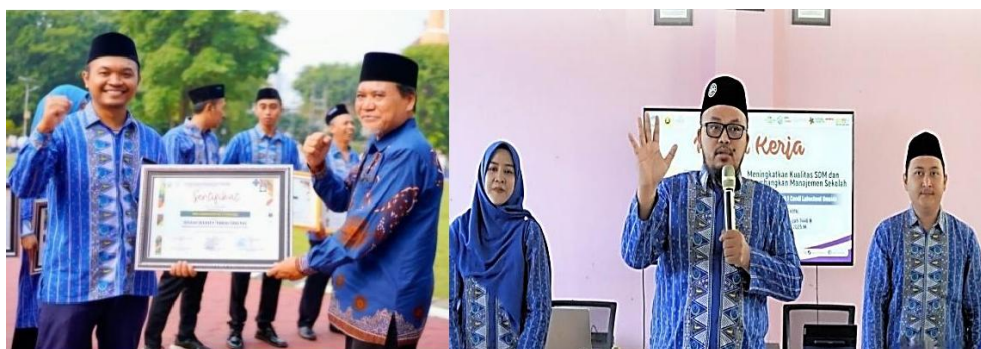
Gambar 6. Pemberian Penghargaan Pada Peringatan Hari Guru Nasional

Gambar 6 diatas terlihat bahwa kegiatan penghargaan bukan hanya menjadi acara seremonial, tetapi juga berfungsi sebagai wadah pengakuan publik terhadap dedikasi guru. Subjek penelitian menyampaikan bahwa momen ini meninggalkan kesan mendalam, karena selain diakui oleh atasan, penghargaan juga disaksikan oleh masyarakat luas. Hal ini menambah dimensi sosial dalam pengakuan yang diterima, di mana pengakuan formal tidak hanya memotivasi secara pribadi, tetapi juga menegaskan posisi guru sebagai tenaga pendidik yang dihormati. Dengan demikian, penghargaan semacam ini memberikan makna ganda: penghargaan personal dari kepala sekolah serta pengakuan sosial dari masyarakat. Dalam wawancara, guru tersebut menjelaskan bahwa bentuk pengakuan yang paling bermakna justru datang dari apresiasi yang diberikan secara langsung oleh kepala sekolah dalam interaksi sehari-hari. Misalnya, ketika guru menyelesaikan tugas tambahan di luar kelas, kepala sekolah memberikan ucapan terima kasih dan dukungan moral. Menurutnya, meskipun bentuk pengakuan itu sederhana, hal tersebut memiliki efek signifikan terhadap rasa percaya diri dan semangat untuk terus berkontribusi. Dari sisi kualitatif, hal ini memperlihatkan bahwa kebutuhan akan pengakuan tidak selalu terkait dengan penghargaan material atau seremonial, melainkan lebih pada rasa dihargai sebagai individu yang berperan penting dalam keberlangsungan pendidikan.