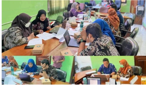
Gambar 1. Rapat Desk Review DIP