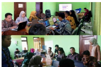
Gambar 3. Pelatihan Konten Website desa.id