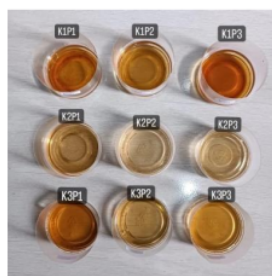
Gambar 1. Warna fisik Cascara

Dari Tabel 8 diatas, menunjukkan tingkat kesukaan panelis terhadap warna teh cascara berkisar antara 2,27 sampai 3,27 (tidak suka-suka). Nilai kesukaan panelis terhadap warna cascara tertinggi pada perlakuan jenis kulit kopi arabika 100% dan lama pengeringan 9 jam (K1P3) yang menunjukkan nilai rata-rata kesukaan panelis terhadap warna teh cascara yaitu 3,27 (biasa-suka) dan berbeda nyata dengan perlakuan lainnya. Hal ini sudah sama dengan nilai redness dan yellowness pada warna fisik tertinggi yaitu perlakuan jenis kulit kopi arabika 100% dan lama pengeringan 9 jam.