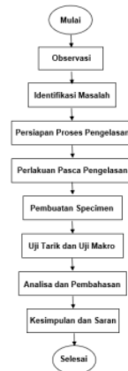
Gambar 1 Alur prosedur penelitian

Pada bab ini, penulis tugas akhir bertujuan untuk menjelaskan berbagai sumber yang dirujuk sebagai referensi untuk mendukung tugas akhir. Berisi tentang penelitian struktur metalurgi baja dan teori-teori yang mendukung untuk pemahaman :