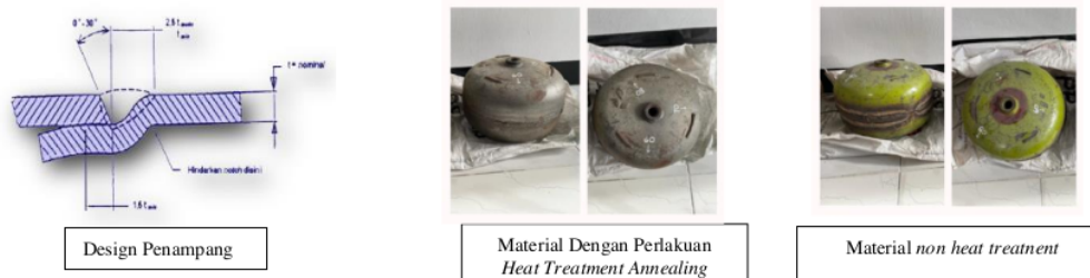
Gambar 2. Hasil proses pengelasan

Dari (Gambar 2.) Pada pengelasan material tabung LPG 3kg yang sudah dilakukan Heat Treatm 9 tidak terjadi penguapan uap air pembentuk gelembung gas yang terperangkap didalam logam cair yang membeku. Dengan adanya perlakuan panas diharapkan dapat membuat struktur butiran di semua daerah lebih seragam dan dapat meningkatkan keuletanya sehingga dapat diperoleh kesamaan sifat mekanik pada hasil pengelasan [11]