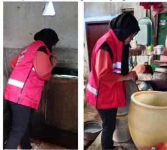
Gambar 4 dan 5 Program Juri Pemantauan Jentik dan Pengontrolan Abate pada Agustus 2024

Berdasarkan hasil wawancara warga, mereka menyetujui adanya program Kader Surabaya Hebat dan Juri Pemantauan Jentik karena kedua program ini langsung memberikan manfaat bagi kesejahteraan dan kesehatan masyarakat. Kader Surabaya Hebat memberdayakan warga untuk lebih aktif terlibat dalam pembangunan kota dengan meningkatkan kualitas sumber daya manusia di tingkat lokal, sementara Juri Pemantauan Jentik membantu memerangi penyakit yang ditularkan melalui vektor seperti nyamuk dengan cara yang lebih efektif dan terorganisir.