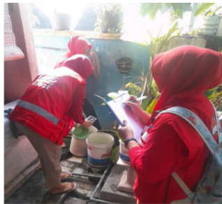
Gambar 2. Kegiatan Juri Pemantauan Jentik oleh KSH pada Agustus 2024