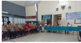
Gambar 3. Evaluasi terbuka seluruh kader di Kecamatan pada Agustus 2024

Berikutnya, peneliti mempertanyakan mengenai kualitas sumber daya baik berupa strategi apa yang digunakan hingga bagaimana cara kader mengidentifikasi kebutuhan masyarakat. Berdasarkan hasil wawancara kader, pada pendampingan program telah diakui cukup namun terbalik dengan pembagian tugas akibat dari sistem on off kinerja kader lainnya. Selain itu demi menjaga kualitas sumber daya yang ada. Para kader merancang strategi pendekatan sosial agar lebih efektif. Apabila pendekatan berhasil diterapkan maka pemantauan kebutuhan masyarakat pun menjadi lebih mudah dan terarah. Berdasarkan hasil wawancara warga, menyetujui adanya pola perkembangan kader dari pendampingan program meski sempat tidak dilakukannya sosialisasi. Adanya masalah dipembagian tugas berhubungan dengan kader tidak menerima keluhan masyarakat karena masih terhenti di sistem pembagian tugas.