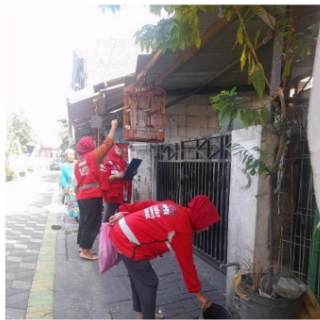
Gambar 1. Pemantauan Pola Hidup Bersih dan Sehat pada Agustus 2024

Berdasarkan hasil wawancara oleh kader, harapan kader dalam program juri pemantauan jentik dapat meningkatkan kesadaran dan partisipasi aktif dari masyarakat. Artinya kader yang termotivasi mampu melaksanakan tugas dengan baik dan menemukan cara cara efektif guna mengedukasi warga terkait pentingnya pemantauan jentik ini. Menanggapi masalah tidak mengadakan sosialisasi Pola Hidup Bersih dan Sehat, sebenarnya kader sudah berinisiatif melakukan intensive check pada Jumantik yang dialami kegiatan sebagai Pemantauan Sarang jentik Nyamuk secara pintu ke pintu. Jadi program jumantik ini pusat program dari pemantauan sarang jentik nyamuk (PSJN) dan pola hidup bersih sehat (PHBS).