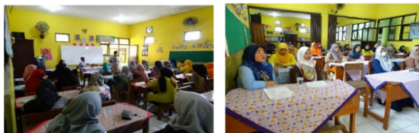
Gambar 1. Kegiatan Sosialisasi Program Indonesia Pintar

Sosialisasi Kebijakan Program Indonesia Pintar (PIP) di SDN Damarsi, Kabupaten Sidoarjo, telah dimulai dengan baik pada tahap awal. Sosialisasi Program Indonesia Pintar (PIP) di SDN Damarsi Sidoarjo berjalan baik pada tahap awal melalui rapat, namun tidak ada sosialisasi lanjutan setelah itu. Hal ini menyebabkan pemahaman terbatas di kalangan penerima manfaat seperti siswa dan wali murid mengenai cara kerja dan mekanisme program tersebut. Komunikasi yang kurang maksimal menghambat mereka dalam memahami prosedur yang benar. Diperlukan sosialisasi berkelanjutan agar informasi tentang PIP dapat dipahami dengan lebih baik memastikan tujuan program tercapai secara maksimal. Berikut dokumentasi sosialisasi Program Indonesia Pintar (PIP) di SDN Damarsi Kabupaten Sidoarjo yang disampaikan kepada orang tua murid dan siswa penerima dana PIP pada awal penerapan.