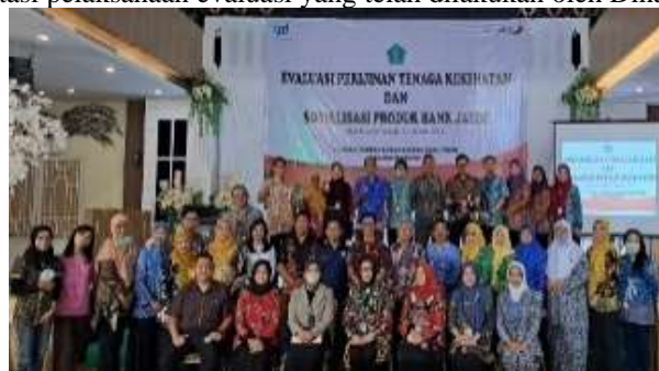
Gambar 6. Evaluasi SIP

Berikut merupakan dokumentasi pelaksanaan evaluasi yang telah dilakukan oleh Dinas Kesehatan.