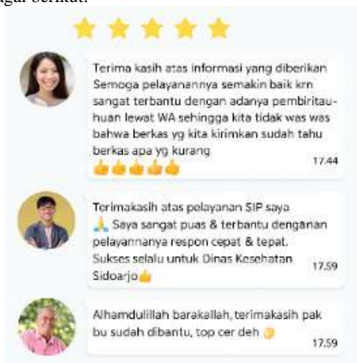
Gambar 5. Testimoni Pemohon SIP

Tujuan tersebut memperoleh respons positif dari tenaga kesehatan dan tenaga medis sebagai pengguna SIP Online, yang dapat diuraikan sebagai berikut: