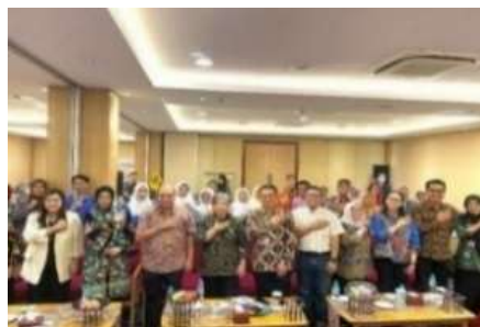
Gambar 2. Dokumentasi Sosialisasi secara Offline

“Sosialisasi kami lakukan melalui media sosial: website Dinkes, IG, WA (baik WA pelayanan maupun WA pribadi), serta pertemuan-pertemuan dengan organisasi profesi.” (Wawancara April 2025) Berikut ini adalah dokumentasi saat sosialisasi SIP Online: