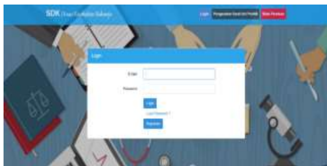
Gambar 1. Tampilan Dashboard SIP Online Sumber : dinkes.sidoarjo.kab.go.id/sip/public (2024)

Berdasarkan hasil wawancara penulis dengan admin SIP Online Dinas Kesehatan Kabupaten Sidoarjo, digitalisasi layanan di Dinas Kesehatan Kabupaten Sidoarjo melalui aplikasi SIP Online dimulai sejak tahun 2020 sebagai solusi inovatif untuk menggantikan proses offline yang sebelumnya dilakukan secara manual. Merupakan aplikasi pelayanan online dalam pengurusan Surat Izin Praktik (SIP) berbasis web yang berada di bawah naungan Dinas Kesehatan. Berikut merupakan tampilan aplikasi SIP Online yang terdiri atas menu login, pengecekan surat izin praktik dan buku panduan berbentuk pdf.