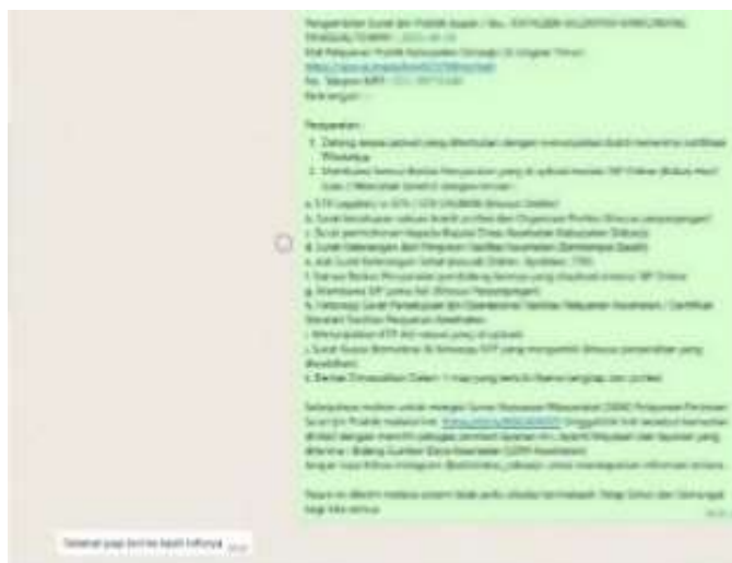
Gambar 4. Informasi Pengisian SKM

Pada gambar di atas, admin SIP Online secara konsisten menyertakan tautan penilaian SKM pada setiap akhir pesan WhatsApp Blast yang dikirimkan kepada para pemohon. Salah satu pemohon menyatakan,