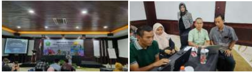
Gambar 3. Fasilitasi Percepatan Updating Data Desa Center BUMDesa