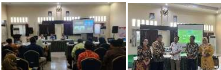
Gambar 4. Kajian Potensi Desa

Berikut ini adalah dokumentasi dan bentuk identifikasi potensi desa dalam kegiatan kajian potensi desa yang diselenggarakan oleh Dinas PMD dengan menggandeng pihak akademisi dari STIESIA, sebagai berikut: