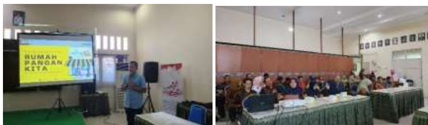
Gambar 2. Kerjasama dengan BULOG

Indikator ini mencakup peran pemerintah sebagai Dinamisator, yaitu pemerintah menggerakkan partisipasi multi pihak (mendorong dan memelihara dinamika pembangunan daerah) jika terjadi kendala-kendala dalam proses pembangunan. Peran dinamisator oleh Dinas PMD dilaksanakan melalui pembangunan kemitraan antara BUMDesa dan pihak luar, seperti investor, sektor swasta, atau lembaga pemerintah lainnya. Hal tersebut diberikan melalui kegiatan Kerjasama BUMDesa dan BUMDesma dengan dinas yaitu Disperindag serta dengan BUMN yaitu Perum BULOG. Ruang lingkup kerjasama yang ditawarkan meliputi Pemberdayaan dan pengembangan BUM Desa dan BUM Desa Bersama dalam rangka stabilisasi harga pangan di Provinsi Jawa Timur. Distribusi penyaluran beras SPHP (Stabilisasi Pasokan dan Harga Pangan), serta Penjualan dan pembelian komoditi pangan pokok komersial dan PSO ( Public Service Obligation )/Pelayanan Publik. Berikut ini adalah dokumentasi saat Dinas PMD memfasilitasi BULOG untuk melakukan paparan terkait kerjasama yang ditawarkannya kepada pengurus desa/BUMDesa yang sudah hadir.