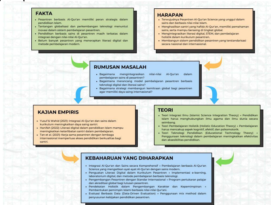
Gambar 1. Kerangka berpikir

Kerangka berpikir dalam bagan tersebut menggambarkan hubungan yang sistematis antara fakta yang ada, harapan yang ingin dicapai, permasalahan yang muncul, kajian empiris, landasan teori, dan kebaruan yang diharapkan dalam pengembangan Pesantren Al-Qur'an Science. Setiap komponen saling terkait secara logis dan membentuk alur pemikiran yang runtut. Kerangka ini menjadi dasar intelektual dalam proses transformasi sekolah.