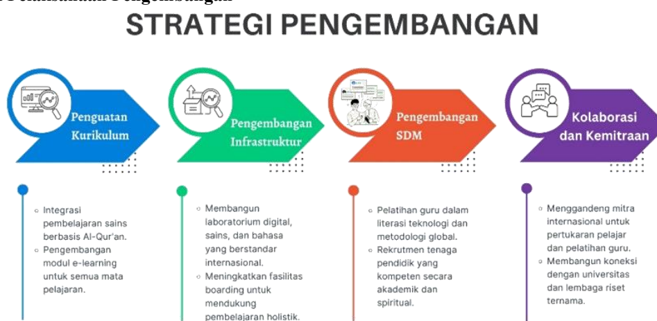
Gambar 2. Strategi Pengembangan