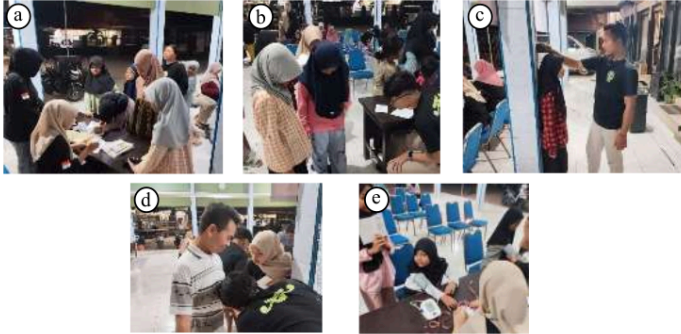
Gambar 3. Dokumentasi Kegiatan Pengukuran Antropometri : (a) Pengisian daftar hadir; (b) Pengukuran berat badan; (c) Pengukuran tinggi badan; (d) Pengukuran LILA & LP; (e) Pengukuran tekanan darah