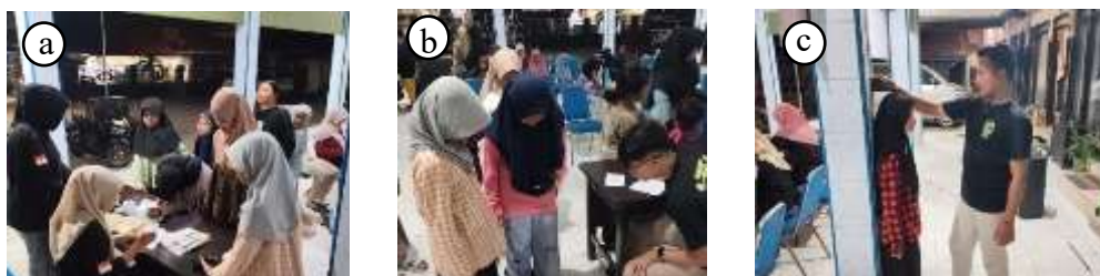
Gambar 3. Dokumentasi Kegiatan Pengukuran Antropometri : (a) Pengisian daftar hadir; (b) Pengukuran berat badan; (c) Pengukuran tinggi badan; (d) Pengukuran LILA & LP; (e) Pengukuran tekanan darah

Berdasarkan wawancara dari beberapa informan tersebut, dapat dipahami bahwa pelaksanaan kegiatan Posyandu Remaja telah berjalan dengan efektif. Kader telah dibekali pelatihan yang memadai untuk melakukan pengukuran antropometri secara mandiri, sedangkan remaja sebagai sasaran kegiatan menunjukkan antusiasme serta pemahaman yang baik terhadap pentingnya pemeriksaan kesehatan secara rutin. Hal ini mencerminkan bahwa program tidak hanya diterima dengan baik oleh masyarakat, tetapi juga mampu meningkatkan kesadaran remaja terhadap pentingnya menjaga kondisi kesehatan secara berkala. Pernyataan ini juga diperkuat oleh dokumentasi kegiatan yang menunjukkan proses pelaksanaan Posyandu Remaja, sebagaimana ditampilkan pada gambar di bawah ini.