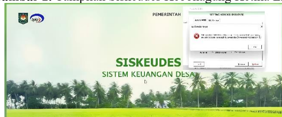
Gambar 2. Tampilan Siskeudes Kebonagung Ketika Error

Meskipun aplikasi Siskeudes di Desa Kebonagung diharapkan dapat membawa kemajuan dalam pengelolaan keuangan desa yang lebih efisien, aplikasi ini sering kali menghadapi kendala yang berkaitan langsung dengan kualitas sistem. Salah satu permasalahan yang paling sering dihadapi adalah gangguan teknis berupa error atau server down yang menyebabkan aplikasi tidak dapat diakses dengan baik. Ketika aplikasi mengalami gangguan, perangkat desa, terutama bagian Kaur Keuangan, tidak dapat mengakses data atau melanjutkan tugas-tugas penting mereka, seperti penginputan transaksi atau penyusunan laporan keuangan. Gangguan teknis ini menyebabkan keterlambatan yang signifikan dalam proses administrasi keuangan, yang tentunya berdampak buruk pada ketepatan waktu pelaporan dan transparansi pengelolaan anggaran desa. Selain itu, masalah kualitas sistem ini memperburuk efektivitas dan efisiensi aplikasi Siskeudes sebagai alat pengelola keuangan, karena waktu yang terbuang akibat gangguan teknis dapat mengganggu fokus dan konsentrasi perangkat desa dalam menjalankan tugas mereka.