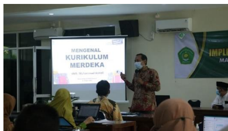
Gambar 2. Rapat Implementasi Kurikulum Merdeka

Berdasarkan penjelasan wawancara tersebut, penerapan Kurikulum Merdeka di MAN Sidoarjo dapat dianggap berhasil karena disposisi positif para guru yang mendukung dan menerima kebijakan tersebut. Sikap ini penting dalam menciptakan lingkungan belajar yang kondusif, yang pada gilirannya memotivasi siswa untuk beradaptasi dengan kurikulum baru. Meskipun ada kekhawatiran awal dari wali murid, seiring berjalannya waktu, mereka mulai merasakan manfaat dan dampak positif dari penerapan kurikulum ini. Keberhasilan implementasi sangat bergantung pada dukungan kolektif dari guru, siswa, dan wali murid, serta kepemimpinan kepala madrasah yang efektif dalam mengarahkan perubahan tersebut.