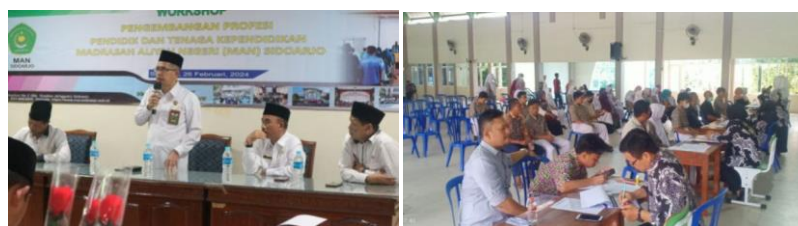
Gambar 1. Pelatihan Workshop dan Kegiatan Sosialisasi Wali Murid di MAN Sidoarjo

Berdasarkan pernyataan di atas, dapat dijelaskan bahwa di MAN Sidoarjo, pelatihan dan sosialisasi merupakan bagian penting dalam implementasi Kurikulum Merdeka. Workshop untuk guru dilakukan menjelang liburan akhir tahun dan dapat melibatkan narasumber dari universitas atau sekolah yang memiliki tenaga ahli terkait dengan kurikulum tersebut. Selain itu, ada berbagai metode pelatihan yang diterapkan, seperti pelatihan offline dengan mendatangkan narasumber ahli, dan pelatihan online yang diselenggarakan oleh Kementerian Agama. Selain pelatihan untuk tenaga pendidik, sosialisasi kepada wali murid juga menjadi perhatian, yang dilakukan sekali setiap akhir semester bersamaan dengan pengambilan rapor, untuk memastikan wali murid mendapatkan informasi yang jelas mengenai kegiatan yang dilakukan di sekolah.