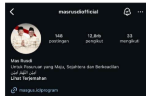
Gambar 2. Akun Instagram Mas Rusdi

Dibandingkan dengan lawan politiknya, akun TikTok Mas Rusdi lebih konsisten dalam mengunggah postingan dan terkelola secara rutin. Konten yang disajikanpun memanfaatkan fitur TikTok seperti musik populer, efek visual, serta story telling yang meningkatkan engagement.