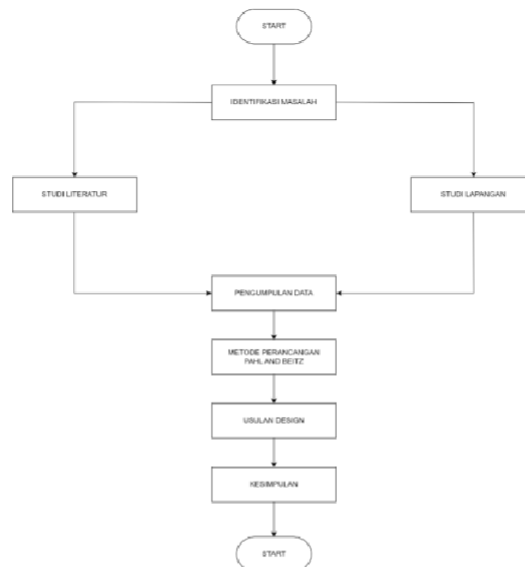
Gambar 3.1 Flowchat Penelitian