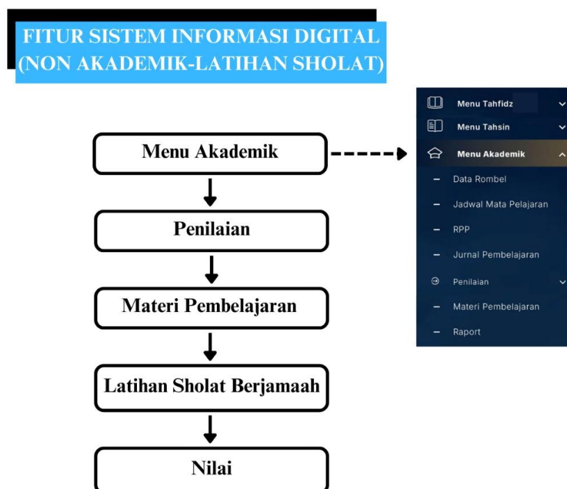
Gambar 3. Fitur Sistem Informasi Digital (Non-Akademik)

Gambar 2 dan gambar 3 menjelaskan adanya proses pembelajaran digital, baik pembelajaran akademik maupun non akademik. Pada fitur sistem informasi digital, penilaian menu akademik (Tahfidz), meliputi kelancaran hafalan, pelafalan makhorijul huruf (tajwid), maupun fashohah. Materi pembelajaran latihan sholat berjamaah berhubungan dengan materi pembelajaran tahfidz, karena pada saat sholat berjamaah seluruh santri membaca dengan suara keras secara bersama-sama. Hal ini bertujuan agar santri melakukan murojaah hafalan mereka. Penilaian yang disarankan yaitu dalam bentuk angka. Angka 1 berarti kurang, angka 2 berarti cukup, dan angka 3 berarti baik.