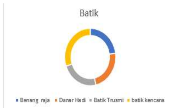
Gambar 1, merek batik favorit masyarakat Indonesia tahun 2024

Berdasarkan gambar diatas, data ulasan penjualan tahun 2024, dapat disimpulkan bahwa keempat merek batik yang disebutkan, yaitu Benang Raja, Danar Hadi, Batik Trusmi, Dan Batik kencana, memiliki tingkat penerimaan yang tinggi di kalangan konsumen shopee. Hal ini menunjukkan bahwa masing-masing merek memiliki keunggulan dan daya tarik tersendiri yang mampu memenuhi kebutuhan dan preferensi konsumen yang beragam. Benang Raja, 91% pengguna merasa puas dengan pembelian mereka. Ini menunjukkan bahwa mayoritas pembeli Benang Raja merasa produk yang mereka dapatkan sesuai dengan ekspektasi dan kebutuhan mereka. Danar Hadi, Dengan persentase kepuasan sebesar 94%, Danar Hadi memiliki tingkat kepuasan pelanggan tertinggi di antara keempat merek yang disebutkan. Ini mengindikasikan bahwa kualitas produk dan layanan Danar Hadi sangat dihargai oleh konsumen. Batik Trusmi, Persentase kepuasan pelanggan Batik Trusmi juga cukup tinggi, yaitu 93%. Ini menunjukkan bahwa Batik Trusmi berhasil memenuhi kebutuhan dan harapan sebagian besar pelanggannya. Batik Kencana, Meskipun memiliki persentase kepuasan sedikit lebih rendah dibandingkan ketiga merek lainnya, yaitu 90%, Batik Kencana tetap mendapatkan respon positif dari sebagian besar pelanggannya.