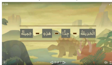
Gambar 1. Tampilan Wordwall Unjamble