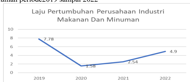
Gambar 1 Grafik Pertumbuhan Industri Makanan Dan Minuman.

Kestabilan dan keberlanjutan dalam pertumbuhan laba mencerminkan kondisi keuangan perusahaan yang sehat serta membuka peluang peningkatan nilai bagi para pemegang saham. Di bawah ini disajikan data perkembangan industri makanan dan minuman periode 2019 sampai 2022