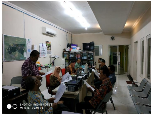
Gambar 1. Dokumentasi Pelayanan Administrasi Kependudukan Pemerintah Desa Dukuhsari

Wawancara tersebut mengindikasikan bahwa Pemerintah Desa Dukuhsari berkomitmen kuat untuk menyediakan pelayanan administrasi kependudukan yang berkualitas dan sesuai dengan kebutuhan warganya. Selain itu, Pemerintah Desa Dukuhsari juga telah proaktif dalam menyebarkan informasi mengenai persyaratan pengurusan administrasi kependudukan melalui Instagram resmi Pemerintah Desa Dukuhsari. Berikut merupakan dokumentasi Pelayanan Administrasi Kependudukan Pemerintah Desa Dukuhsari sebagai berikut: