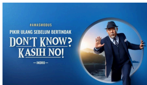
Gambar 1. Don't Know? Kasih No.!

Sebelum iklan bertajuk " Don't Know? Kasih No! " tersebut diluncurkan pada tahun 2023, Bank Central Asia (BCA) pada tahun 2021 juga sempat mengeluarkan iklan dengan tagar #AwasModus, sama seperti dengan iklan yang dibintangi oleh Indro Warkop tersebut, iklan ini pula berisikan informasi kepada nasabah terhadap penipuan berupa iklan website palsu yang mengatasnamakan BCA/HaloBCA. Nasabah Bank BCA di wilayah Sidoarjo dipilih sebagai subjek penelitian karena mereka merupakan pengguna aktif layanan digital perbankan dan termasuk audiens primer dari kampanye tersebut. Resepsi nasabah menjadi penting untuk dikaji guna mengukur sejauh mana kekuatan pesan dalam iklan mampu membentuk pemaknaan, meningkatkan kesadaran, dan mendorong tindakan preventif terhadap kejahatan siber.