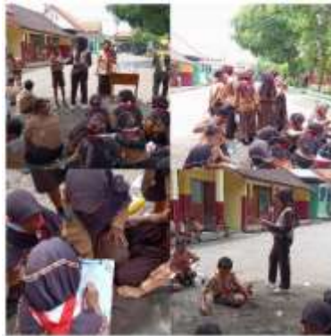
Gambar 4. Guru Mendampingi Peserta Didik dalam Kegiatan Proyek