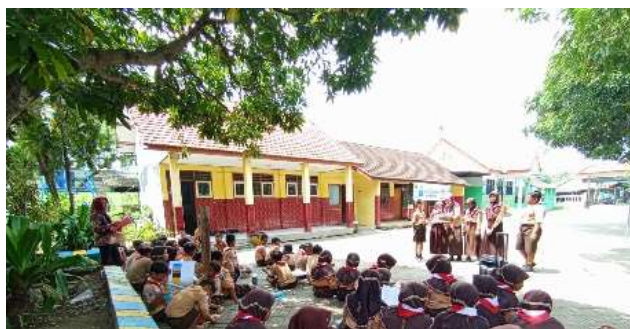
Gambar 7. Guru Menilai Hasil Projek Kelompok

Evaluasi selanjutnya guru menggunakan rubrik penilaian berdasarkan panduan dari Kemendikbud. Rubrik utama P5 berisikan dimensi, sublemen dan kriteria penilaian. Rubrik penilaian P5 terdiri dari beberapa komponen utama yang membantu mengevaluasi pencapaian peserta didik secara objektif. Komponen pertama adalah aspek penilaian, yang mencakup keterampilan dan sikap yang dinilai, seperti kolaborasi, kreativitas, berpikir kritis, dan refleksi diri. Komponen kedua adalah indikator penilaian, yaitu deskripsi spesifik tentang perilaku atau hasil yang menunjukkan tingkat pencapaian dalam setiap aspek. Komponen ketiga adalah skala penilaian, yang biasanya berbentuk kategori (misalnya: sangat baik, baik, cukup, perlu perbaikan) atau rentang angka untuk menggambarkan tingkat ketercapaian. Komponen keempat adalah deskripsi tingkat pencapaian, yang menjelaskan secara rinci karakteristik kinerja peserta didik pada setiap level skala. Dengan adanya komponen-komponen ini, rubrik dapat memberikan penilaian yang lebih terstruktur dan bermanfaat sebagai umpan balik bagi perkembangan peserta didik. Evaluasi dilakukan tidak hanya berdasarkan hasil akhir, tetapi juga pada proses belajar, keterlibatan, serta penerapan nilai-nilai Profil Pelajar Pancasila.