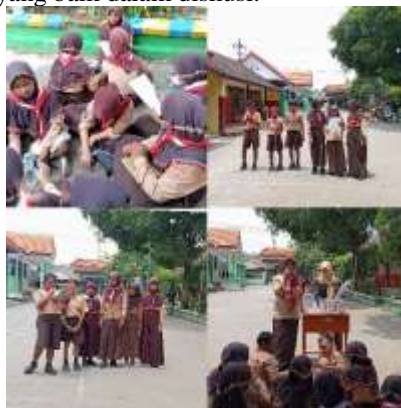
Gambar 6. Guru Sebagai Moderator Memandu dalam Diskusi

peran penting dalam memastikan diskusi kegiatan P5 berjalan efektif. Sebagai moderator, guru harus memandu diskusi dengan jelas, menetapkan tujuan yang terarah, serta menciptakan lingkungan yang terbuka dan inklusif. Guru mendorong partisipasi aktif setiap peserta didik dengan memberikan pertanyaan pemantik, mendengarkan pendapat, dan menengahi perbedaan pendapat secara bijak [31]. Selain itu, guru harus mengelola waktu dengan baik, memastikan diskusi tetap fokus, serta menyampaikan umpan balik yang membangun agar peserta didik dapat merefleksikan pemikirannya. Dengan peran yang optimal, guru dapat mengembangkan keterampilan peserta didik dalam berpikir kritis serta komunikasi yang baik dalam diskusi.