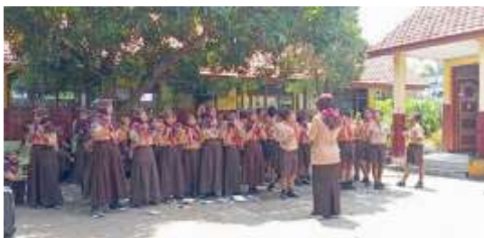
Gambar 2. Guru Mengkoordinasi Peserta Didik dalam Kegiatan Proyek