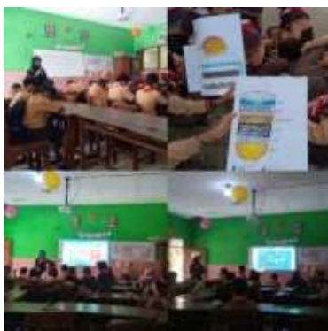
Gambar 3. Guru Memfasilitasi Kegiatan Proyek

Sebagai fasilitator, guru bertugas dalam mengembangkan keterampilan peserta didik, guru bukan sekedar memberikan materi, akan tetapi juga mengajarkan dalam berpikir kritis, kreatif, dan gotong royong. Dalam kegiatan P5, peserta didik dapat mengembangkan pemikiran kritis dengan menganalisis informasi dengan lebih dalam serta dapat melihat permasalahan dari berbagai sisi. Berdasarkan hasil wawancara pada guru kelas IV, untuk mengembangkan berpikir kritis pada peserta didik, guru memberikan sebuah tantangan agar mampu dalam bernalar kritis sehingga dapat muncul pemikiran inovatif yang dapat menyelesaikan tantangan tersebut [27]. Peserta didik dapat mengembangkan kreativitasnya dengan menemukan solusi baru dan berani mengungkapkan ide-ide mereka. Sedangkan gotong royong menanamkan rasa saling peduli, saling mendukung dan menghargai pendapat teman kelompok. Sebagai fasilitator guru perlu memberikan dorongan agar peserta didik berpartisipasi secara aktif dalam kegiatan P5 dengan tingkat perkembangan dan kemampuan peserta didik dalam setiap tahapan, kegiatan baik secara individu maupun kelompok [28].