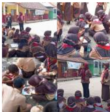
Gambar 5. Guru Mengawasi dan Mengarahkan Kegiatan Proyek